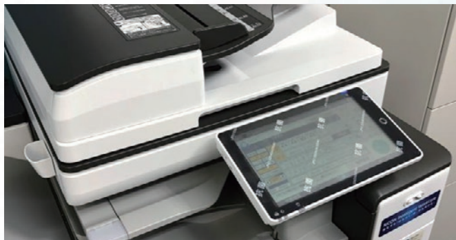
様々なタッチパネル類