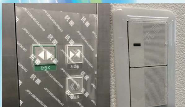
エレベーターボタン・スイッチ類