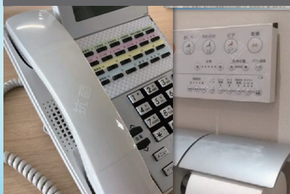
受話器・様々な器具類